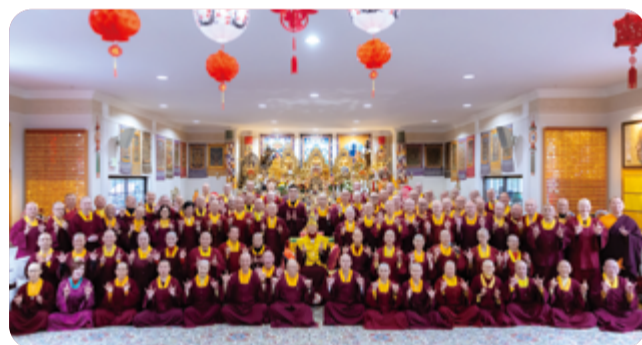
第六屆第三次春季 上師暨常務委員大會 假「彩虹雷藏寺」護摩寶殿 隆重拉開序幕

2024 年 2 月 26、27 日假「彩虹雷藏寺」護摩寶殿舉行真佛宗第六屆第三次春季上師暨常務委員大會，約有 80 多位上師共同與會。