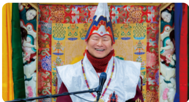
感恩聖尊首傳「七眼佛母天眼通秘密法」 白度母加持 修氣飲符 三者合一天眼開

感恩 根本上師慈悲首傳「七眼佛母天眼通秘密法」，暨二轉「聖觀音第一富豪大法」，令弟子不僅蒙聖觀音護佑，具足入世的福德資糧；更蒙七眼佛母加持，得天眼神通殊勝密法因緣。