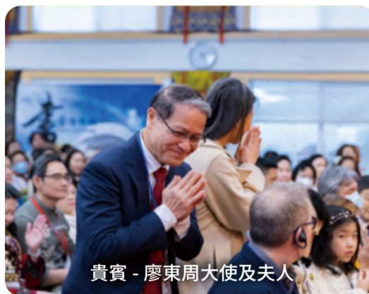
貴賓 - 廖東周大使及夫人