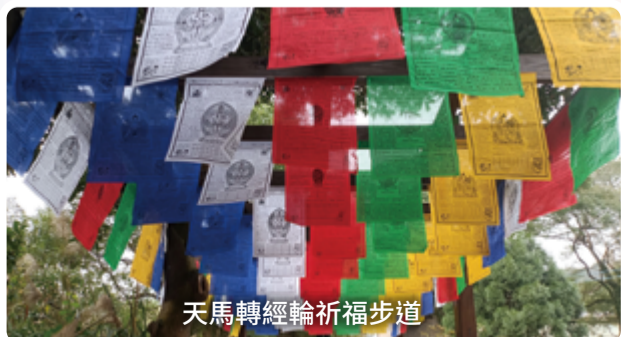
天馬轉經輪祈福步道