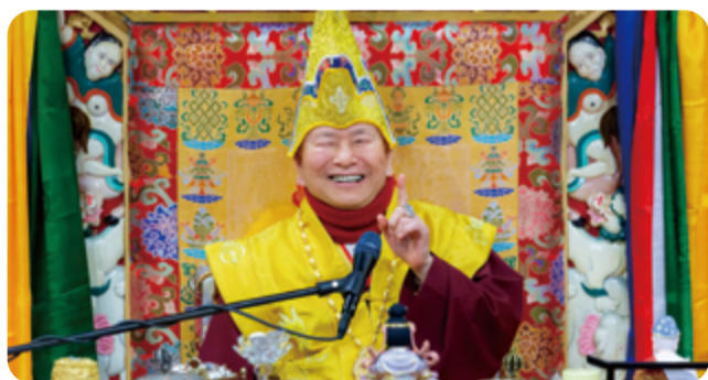
法王長年習練瑜伽 身強體健活力足 配合呼吸法可入三昧地 能發露佛性

在「彩虹雷藏寺」的護摩法會中，盧師尊二度傳授「聖觀音第一富豪大法」，就是希望賜給弟子們充足的修行資糧。但有了福份，若沒有健康的身體來修行，再多福份也是空花水月。因此盧師尊勉勵弟子要多修練瑜伽，不僅可以強身健體，更有助於入三昧地，發露佛性。