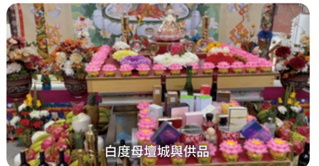
白度母壇城與供品

你們買到第299冊，裡面有白度母天眼法的摘要，主要就是祂的修持法。祂的供品是「三白三甜」、另外還有七顆白色的水晶透明珠，象徵白度母的七個眼睛。修持儀軌是四皈依、四無量心、發菩提心。誦讚是「普願眾生脫離六道。永斷生死續登佛地。唯願慈悲大白度母。天眼如一得妙觀察。平等加被悉地成就。」我讚偈是這樣子寫的。其實，讚偈你們都可以