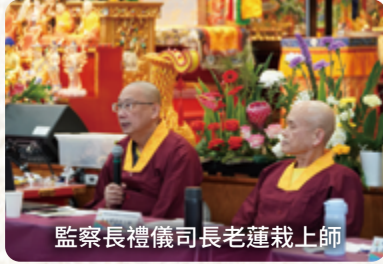
監察長禮儀司長老蓮栽上師