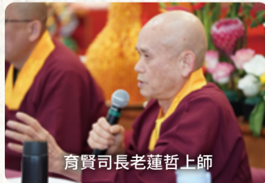
育賢司長老蓮哲上師