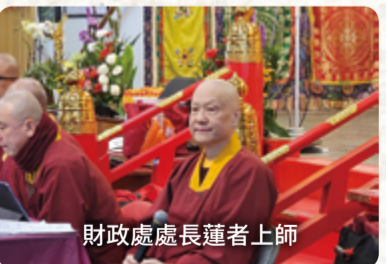
財政處處長蓮者上師