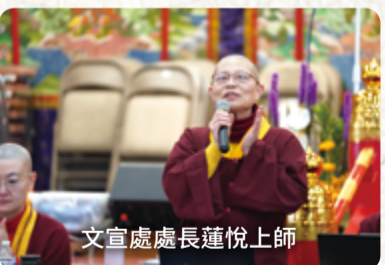
文宣處處長蓮悅上師