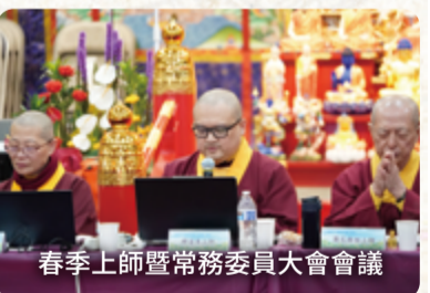
春季上師暨常務委員大會會議