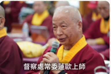
督察處常委蓮歐上師