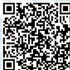
▲深入蓮生法王的智慧殿堂，請點擊——真佛般若藏 QR code