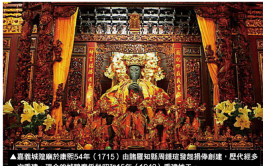
▲嘉義城隍廟於康熙54年(1715)由諸羅知縣周鍾瑄發起捐俸創建，歷代經多次重建，現今的城隍廟係於昭和15年(1940)重建竣工。