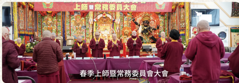
春季上師暨常務委員大會