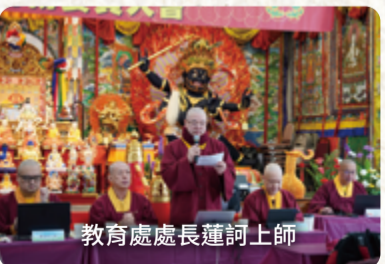
教育處處長蓮訶上師