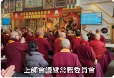
上師會議暨常務委員會