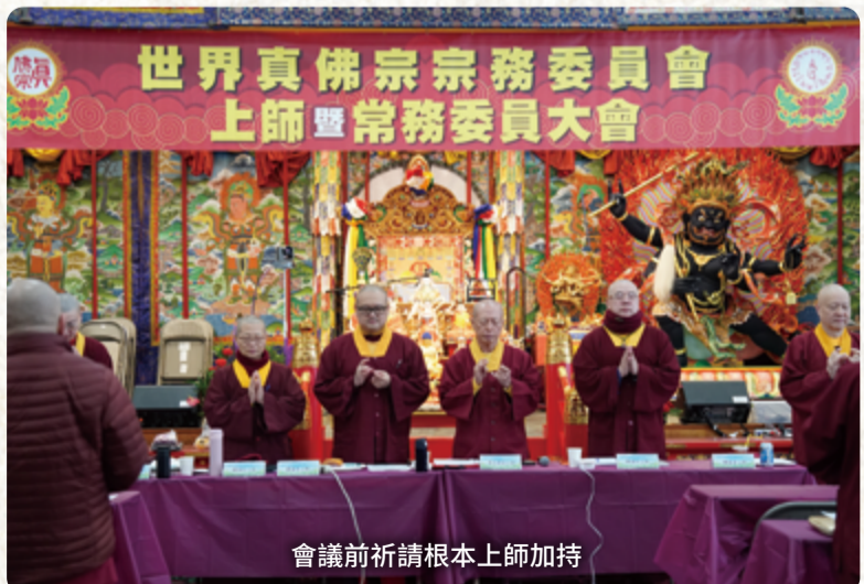
會議前祈請根本上師加持