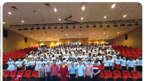
少東上師於培群獨中舉行講座