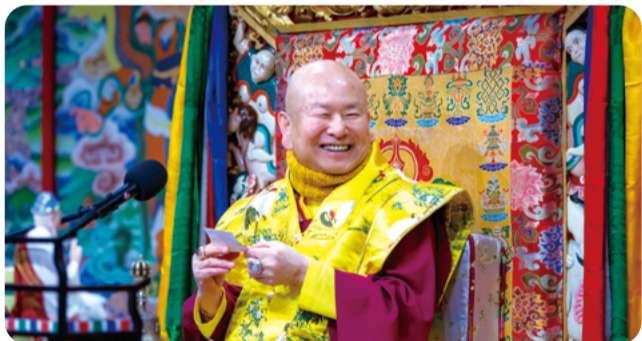
長生學只能延長壽命 密法才是究竟道 九節佛風不必觀想 但一定要控制呼吸

在週六同修後「你問我答」環節中，有台灣弟子提問：自身周圍不少同門執迷「長生學」，漸漸不再到道場同修，依止「長生學」而偏廢「真佛密法」是否會失去傳承？盧師尊認為真佛密法裡就有完整的氣、脈、明點修持之法，這個比養生學還高，養生學只是教你延長壽命，氣、脈、明點內法，到最後還教你打開五輪，全部光明顯現，光集合起來，最後成就「虹光化現」，這個才是「究竟」。