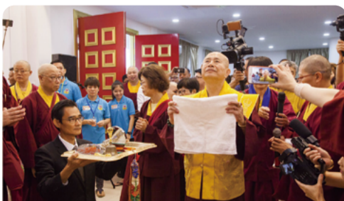
師尊為傳律雷藏寺壇城開光