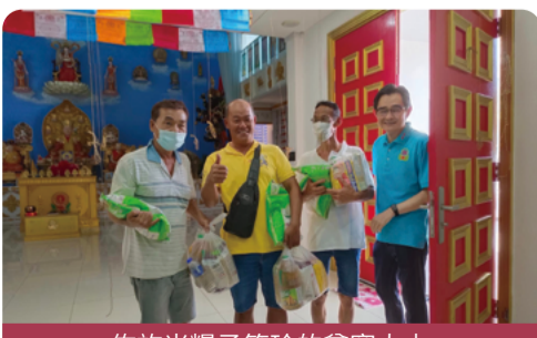
佈施米糧予笨珍的貧寒人士