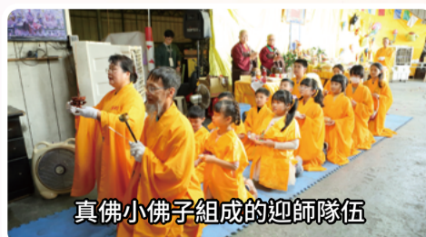
真佛小佛子組成的迎師隊伍