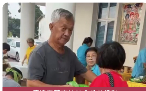
傳律雷藏寺的社會公益活動