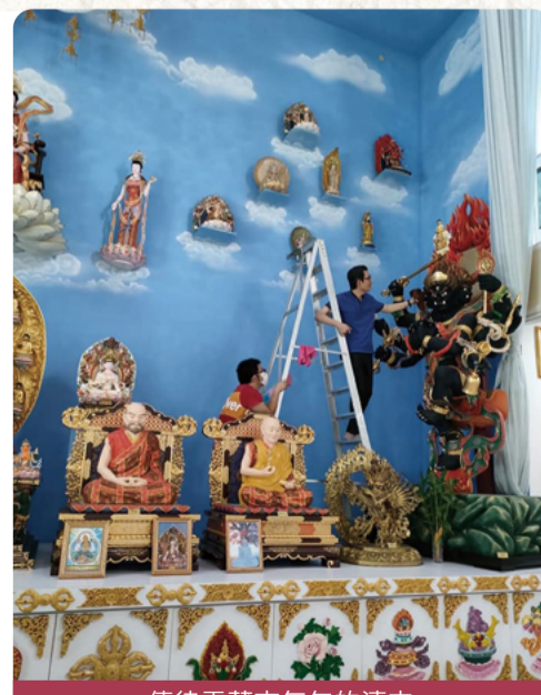
傳律雷藏寺每年的清屯