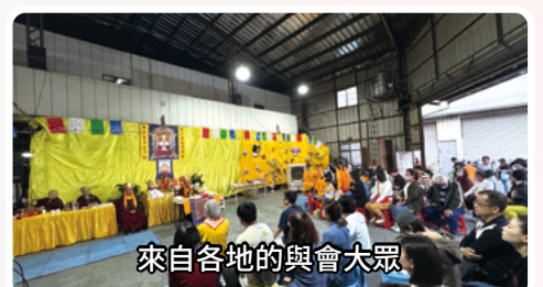
來自各地的與會大眾