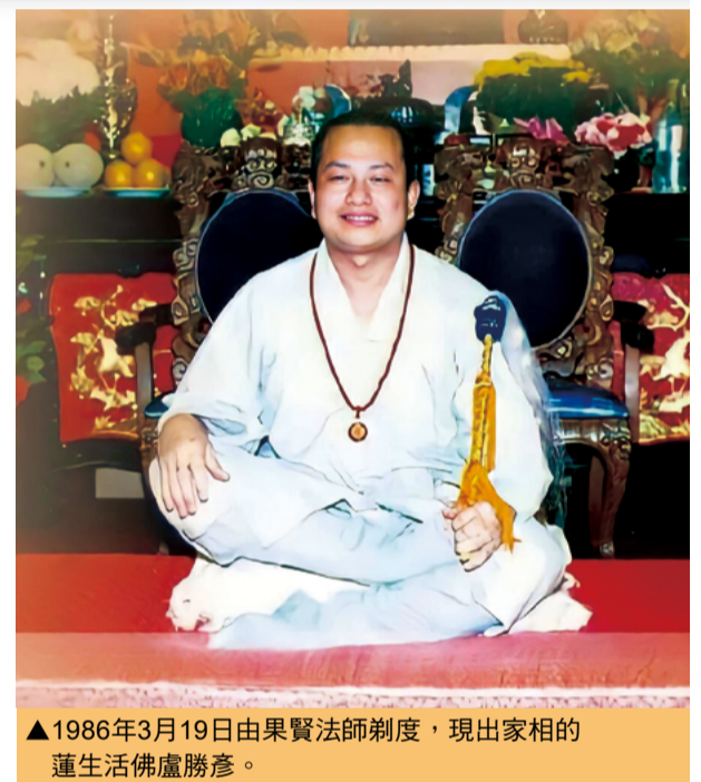
▲1986年3月19日由果賢法師剃度，現出家相的蓮生活佛盧勝彥。