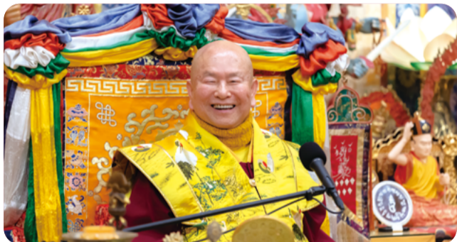
見妙喜世界 願眾等生彼佛土 神通自在 信解維摩詰經 為他說者 得菩提心授記

蓮生活佛開示：「一切本來就是『真空』，所有因緣所生的，全部都是『妙有』。所謂真空就是『無為法』、『出世法』，妙有就是『有為法』、『入世法』。真空就是『究竟』，就是『根本智』；妙有就是『不究竟』，就是『分別智』。」