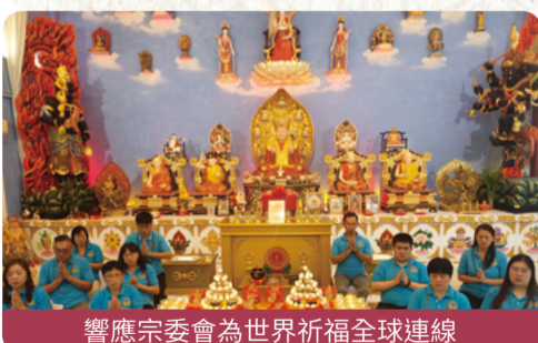
響應宗委會為世界祈福全球連線

因此，歡迎您們以您們的心意來支持《真佛宗》：但願真佛弟子們能成立一座座讓大家感覺寧靜可以清修的所在，一座座醞釀著根本上師的智慧的空間，一座座首重「傳承與戒律」的《真佛宗》道場，讓殊勝的〈真佛密法〉永續飛！