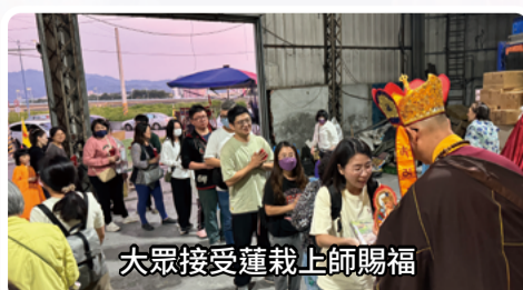
大眾接受蓮栽上師賜福