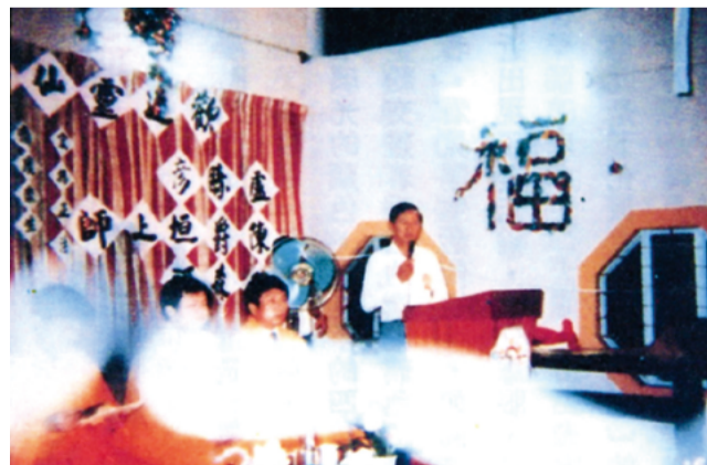
▲1985年4月16日 蓮生活佛到馬來西亞沙巴州亞庇市，本覺堂舉辦的晚上七時的傳授密法，同時為眾弟子舉行集體灌頂，「蓮生活佛」閉目，上身心胸，迸射白毫之光，由左至右，先直射，再下折，再上折，充滿了整張照片。見此「心輪燈光」者，莫不動容，全部皈依。

現居士身的蓮生活佛，雖無法為弟子行披剃及授三壇大戒，不過卻有數百位出家僧人的弟子，連南傳僧人、西藏活佛均在其中，因此有人提出疑議，以居士身卻受出家僧眾的頂禮膜拜，這是不是顛倒佛制