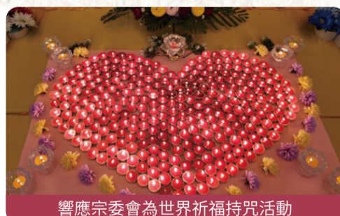
響應宗委會為世界祈福持咒活動