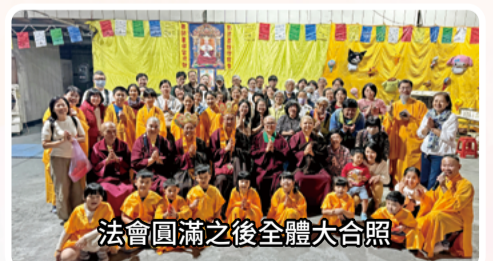
法會圓滿之後全體大合照