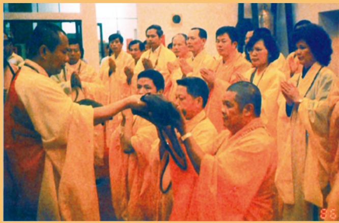
▲1986年8月31日丙寅年超渡法會，真佛宗首次正式授[在家菩薩戒]。