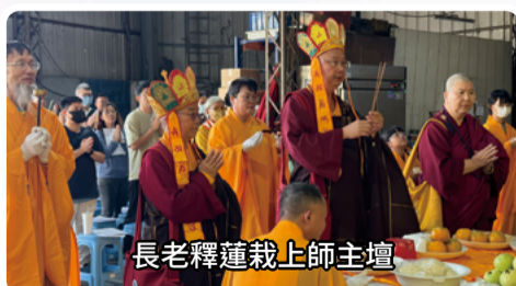
長老釋蓮栽上師主壇

蓮栽長老是位敬師、重法、實修的真佛行者。此次法會能順利圓滿完成，要感謝長老、教授師、法師及幫忙籌備的同門，和與會大眾的護持。噯嘛呢唄咪吽！