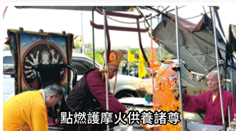
點燃護摩火供養諸尊