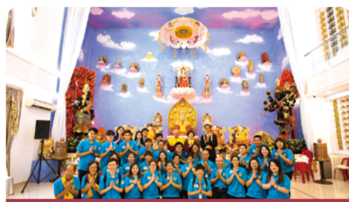
2017年法會後師佛與大眾合影