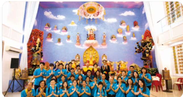
2023 年真佛宗優良道場巡禮 東南亞藝術殿堂「傳律雷藏寺」

馬來西亞「傳律雷藏寺」首度榮獲優良道場殊榮，馬來西亞笨珍這個小漁村，位在荒山僻野，根本沒幾位同門，但在一次大火後，開啟了成立道場的因緣。這個道場號稱是「東南亞的藝術殿堂」，可想而知，道場建造充滿藝術氛圍。