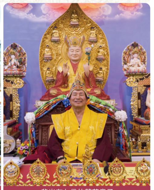
背光有七佛的蓮花童子