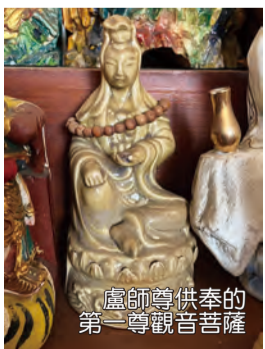
盧師尊供奉的第一尊觀世音菩薩

他就老實告訴我，這觀世音菩薩本身來講，就是人家送給他的，為什麼送給他？因為祂本來手上托著一個淨瓶，那淨瓶斷了，就是手這樣子，空的！一隻手垂下的，坐相的瓷器的觀世音菩薩。我說：「斷了無所謂，你就把這尊觀世音菩薩賣給我。」義士書局的老闆也認得我，他也想出版我的