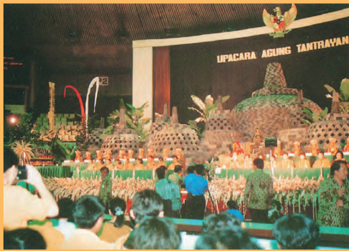
▲1990年6月9日在雅加達史納延大法會，一萬八千人與會盛況，為印尼從殖民到開國四-五百年間僅見。法座後面的佈景是「天下八景」之一的日惹加達的佛塔，象徵佛教最高的精神象徵。