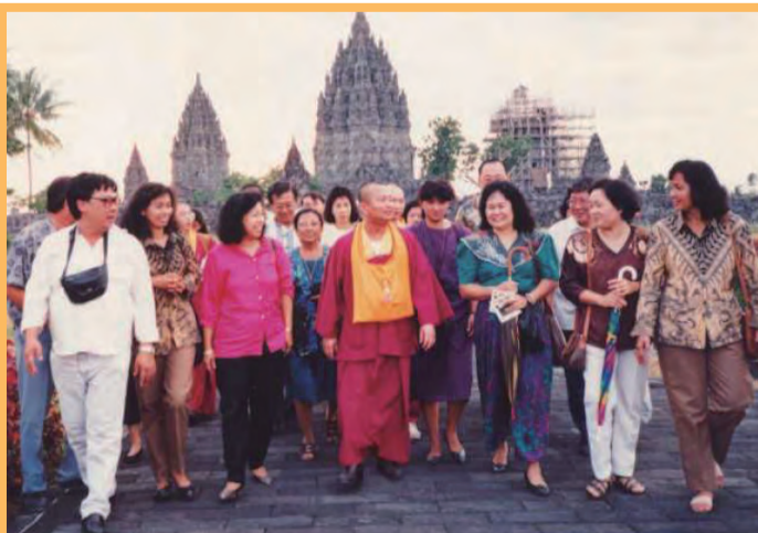
▲蓮生活佛與弟子參觀「日惹加達」的婆羅浮屠。