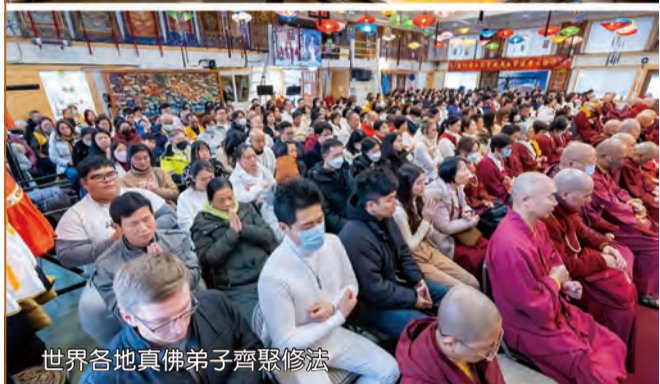
世界各地真佛弟子齊聚修法