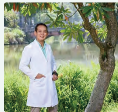
作者簡介 洛桑加參

一般被稱為「負面情緒」的憤怒、焦慮、厭世等等，並非全然一無是處。它們可能是你身心靈失衡的提醒。將負面情緒視為「微徵兆」，它們或許還可以幫我們提前預防一些疾病的發生或惡化。比方說，慢性疲勞的人、交感神經過度亢奮的人、血糖不穩的人、帶有敵意性格的人、心存偏見的人，都比一般人更容易火大。而睡不好的人、脾胃失養的人、腦神經傳導物質失衡的人、有心理創傷的人，焦慮起來更是沒完沒了，很難喊停。至於厭世，休息不夠的人、罹患憂鬱症的人、腦霧腦過勞的人，也都有機會遇到。永遠不要因為出現負面情緒而苛責自己，好好理解這些調整訊號，我們定能逐步恢復健康。