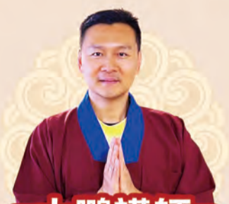
大鵬講師 歐洲地區

我們的服務是**免費且保密**的，無論你需要的是短暫的傾訴還是長期的心理支持，我們都會全力以赴，讓你感到安全和被關懷。