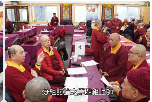
分組討論之第四組上師