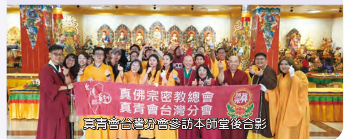
真佛宗密教總會 真青會台灣分會 真青會台灣分會參訪本師堂後合影

本次支援大義雷藏寺法務以及道場參訪，本師堂堂主熱心安排午餐與真青們餐敘交流相談甚歡，至此畫下圓滿句點。這是一個很好的緣起，期望台灣真青會持續動起來，為宗派注入新活力。