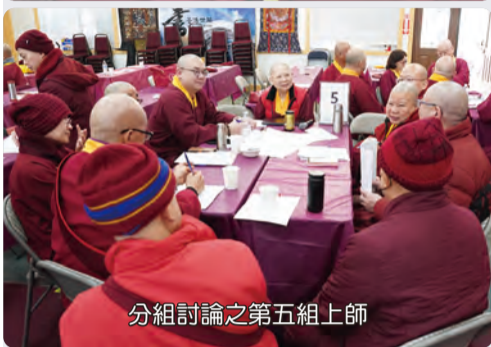
分組討論之第五組上師