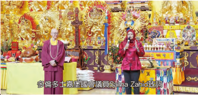
多倫多士嘉堡國會議員Salma Zahid致詞