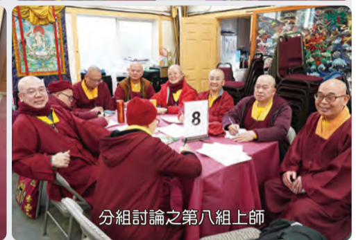
分組討論之第八組上師

2025 盛大的春季法會後，緊接著於 2025 年 2 月 10、11 日假座彩虹雷藏寺護摩寶殿，召開第六屆第五次春季上師暨常務委員大會，共有 75 位上師與會。