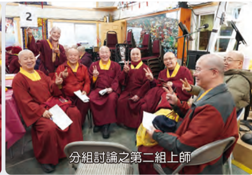
分組討論之第二組上師