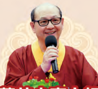
蓮花少東上師 香港及加拿大地區