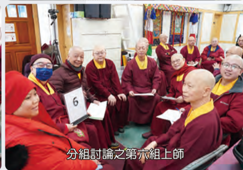
分組討論之第六組上師