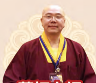
蓮訶上師 南美地區