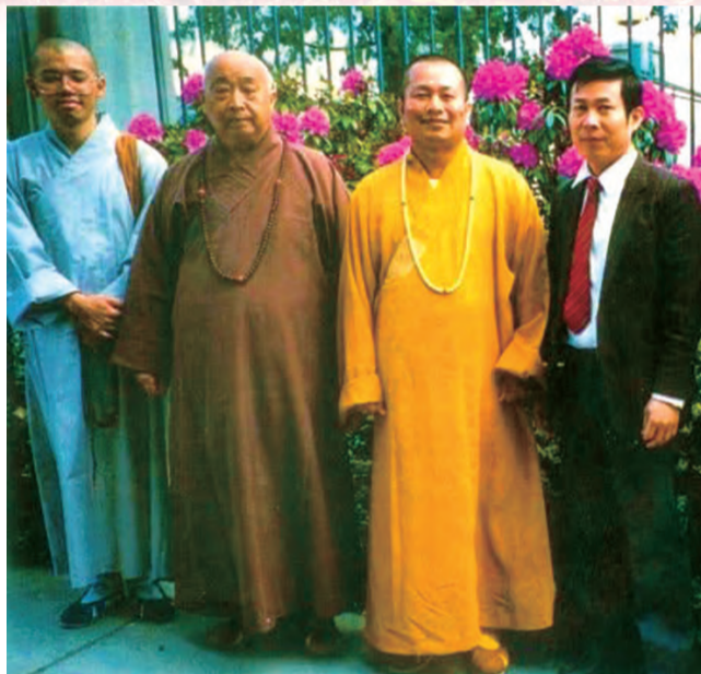
▲1989年4月17日蓮生活佛率弟子到海明寺親訪悟明長老(左二)，對於長老的接納與鼓勵銘感於心。

「幻生法師」在蓮生活佛開示的數百卷錄音帶中，只偶聽一卷「神祕的經驗」，以及在第二本靈書中一則聽來的傳說，即撰文〈批盧論〉，在《慈濟道