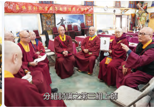
分組討論之第三組上師