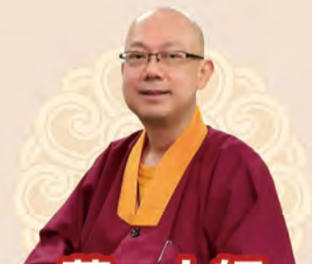
蓮一上師 馬來西亞地區