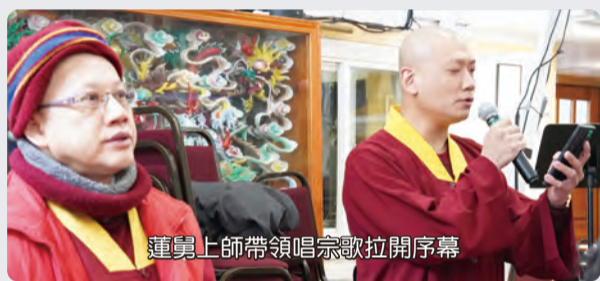
蓮舅上師帶領唱宗歌拉開序幕

2025 盛大的春季法會後，緊接著於 2025 年 2 月 10、11 日假座彩虹雷藏寺護摩寶殿，召開第六屆第五次春季上師暨常務委員大會，共有 75 位上師與會。