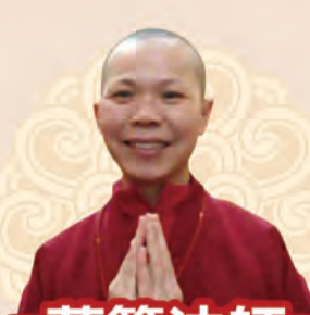
蓮籠法師 歐洲地區