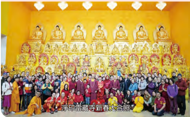
淨印雷藏寺新春大合照