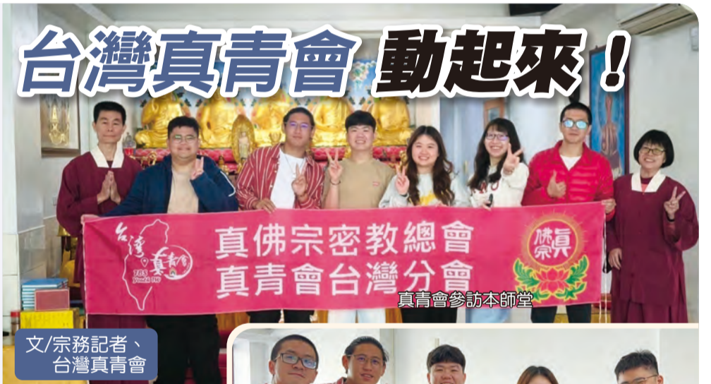
真青會參訪本師堂