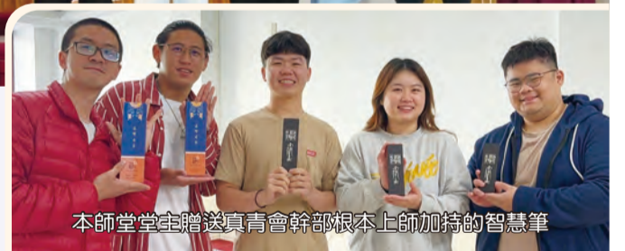
本師堂堂主贈送真青會幹部根本上師加持的智慧筆

隨後堂主感謝青年發心幫忙宗務，對於大家的熱忱深受感動，遂與台灣真青會結緣 根本上師加