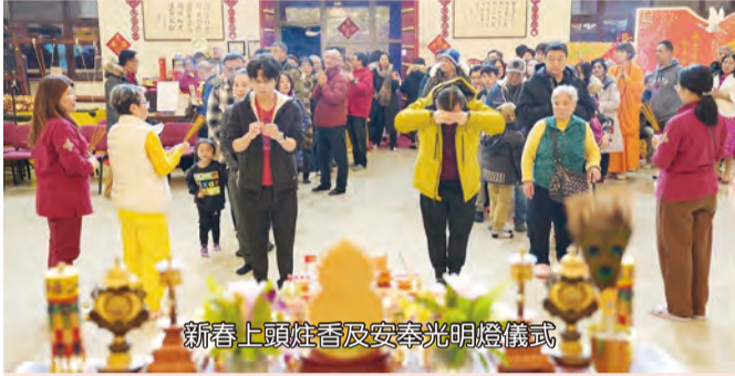
新春上頭炷香及安奉光明燈儀式

多倫多士嘉堡國會議員Salma Zahid，每年也都會親臨淨印雷藏寺上頭炷香祈福求願。今年議員一樣的準時到達淨印雷藏寺，不同的是，議員為表揚淨印雷藏寺蓮雄上師一直以來對社會的貢獻，特頒發「查理斯三世國王加冕獎章(查理斯三世國王加冕獎章King Charles III Coronation Medal)」授予蓮雄上師，在2025年的新春獲知此一喜訊，整個雷藏寺更加顯得喜氣洋洋，為蓮雄上師高興。