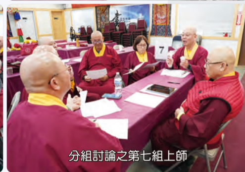
分組討論之第七組上師