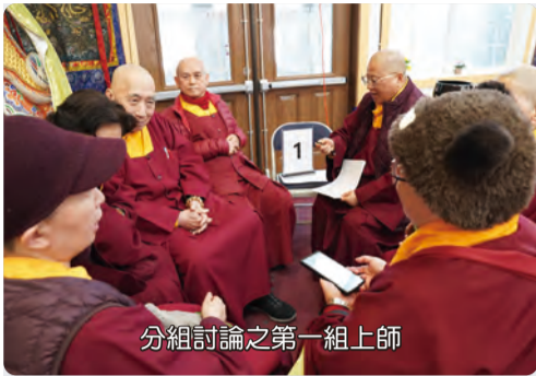
分組討論之第一組上師