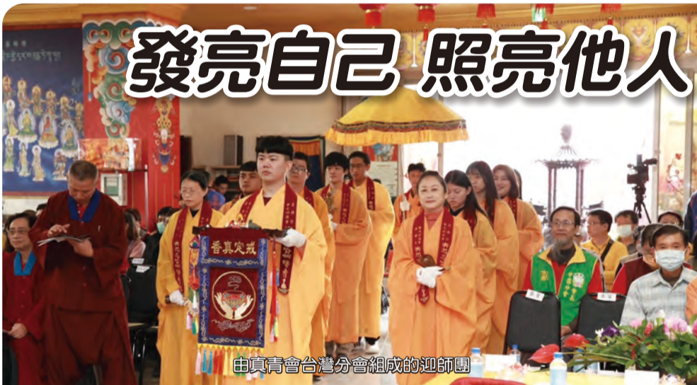
由真青會台灣分會組成的迎師團