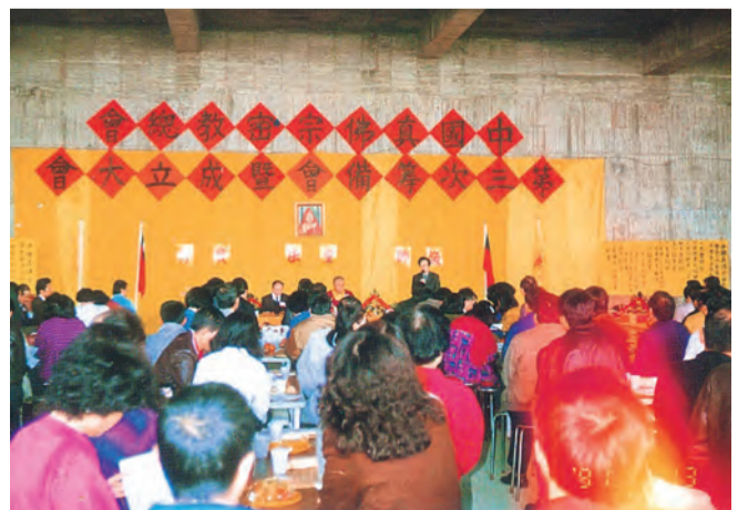
▲「中國真佛宗密教總會」籌備會，以這個總會，來連繫所有台灣的分堂，建立推動法務的共識。

於是，台灣弟子疾呼：「不能坐視自己的宗派受排擠，自己的創辦人受毀謗。我們要有一個團體，由政府維護，受法律保護。」於是，1991年4月13日，在台灣台北國際會議中心的大會堂，舉辦「中國真佛