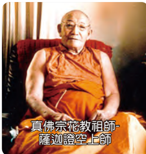
真佛宗花教祖師- 隆迦證空上師