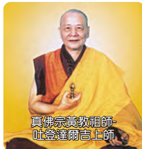
真佛宗黃教祖師- 吐登達爾吉上師

甘珠活佛，就是甘珠爾瓦，是蒙古的大活佛，蒙古最大的活佛就是哲布尊丹巴，再來就是甘珠爾瓦跟章嘉活佛，所以我們的時輪金剛是大活佛給予的傳承。